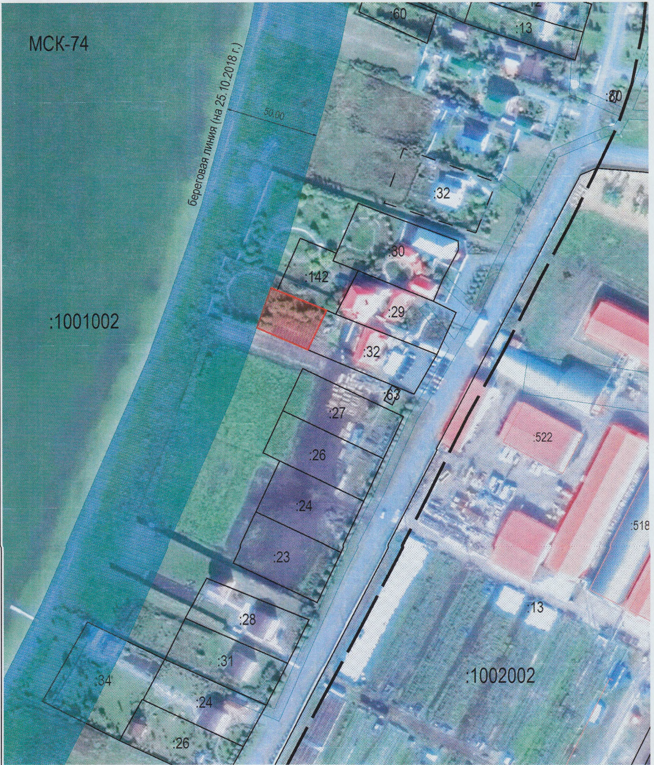
Масштаб 1:2 000